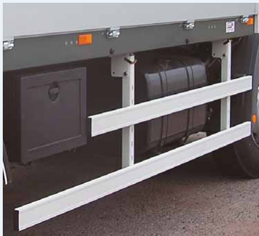
Podjezdová zábrana ▲