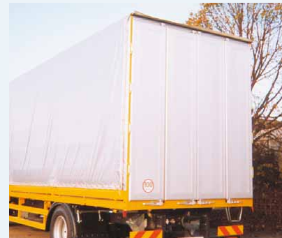
Zadní vrata ▲