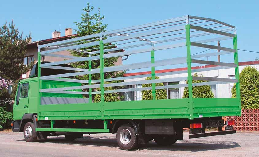
Galaxit Super Light ▲