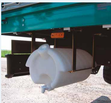
Souděk na vodu ▲