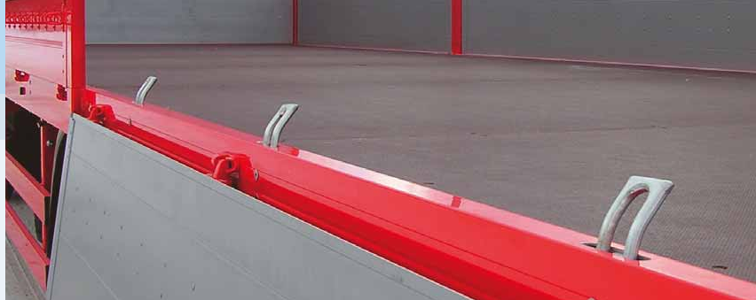
Kotevní úchyty v rámu vozu ▲