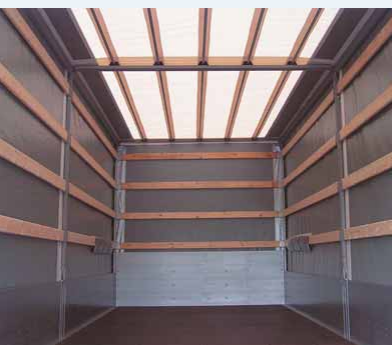
Interiér Light ▲