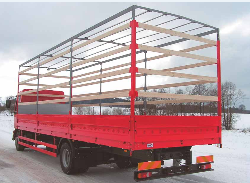
Galaxit Light ▲