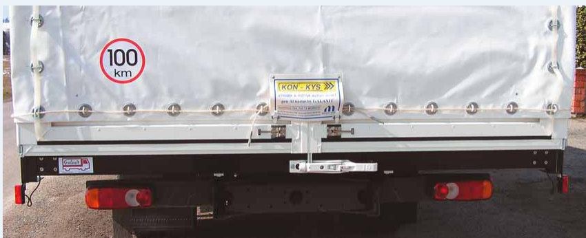
Zadní vrátka ▲