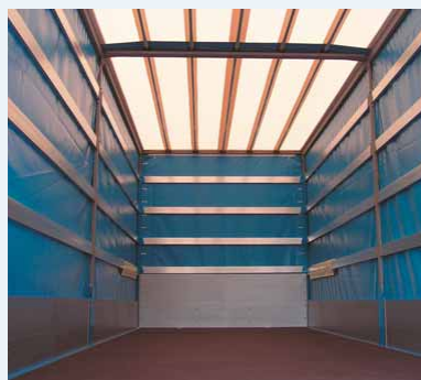
Interiér Super Light ▲