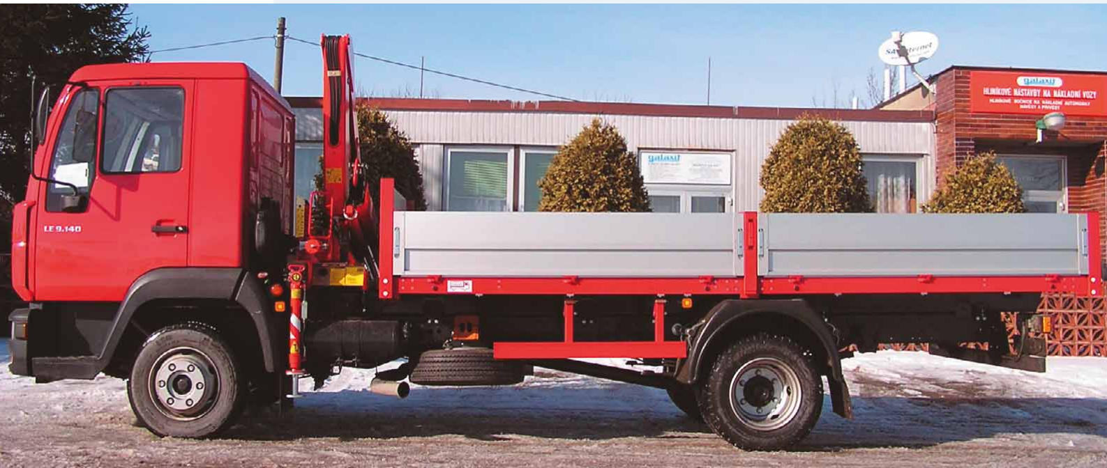
Hydraulická nakládací ruka ▲