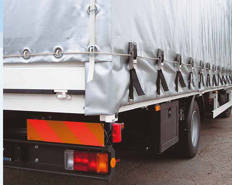
▲ Kombinované řešení s jednostrannou shrnovací plachtovou konstrukcí. ▲