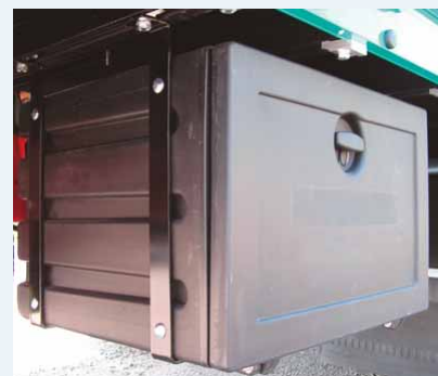
Schránka na nářadí ▲